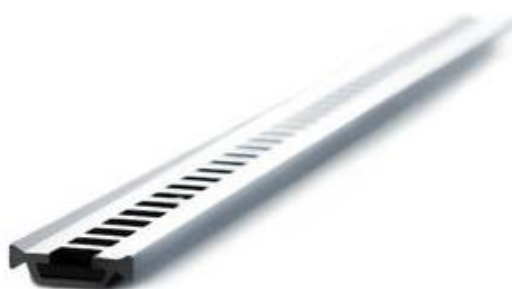
Полиамидный термомост Anti Bi-Metal

Использование полиамидных термомостов «Anti Bi-Metal» шириной (32 мм) в профилях створок позволяет компенсировать изменения возникающие в профиле, в следствие воздействия различных температур на внутреннюю и наружную чашки алюминиевого профиля.